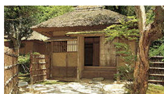
水戸光圀公の別邸 西山荘