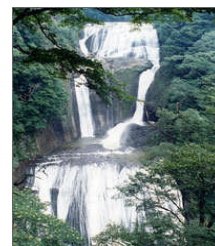
日本三名瀑の袋田の滝